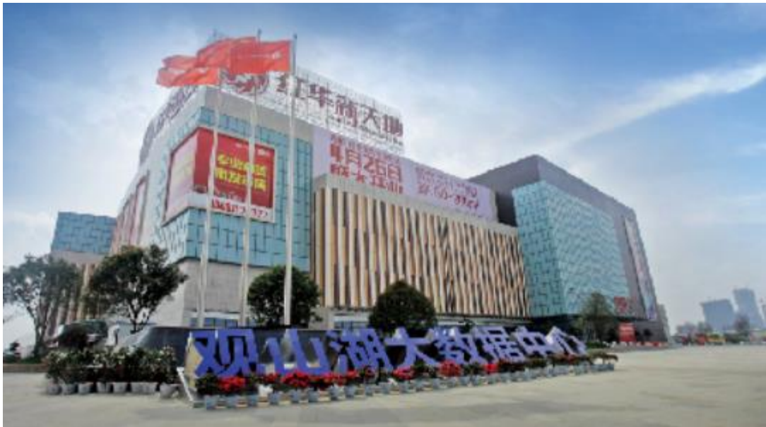
(3) 窠官服务外包及呼叫中心综合产业园：